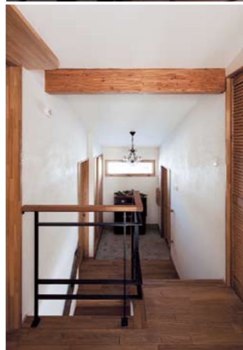
2階から中2階に位置する玄関ホールを望む