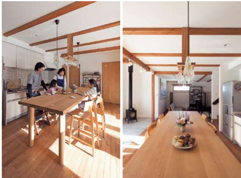
右: ダイニング・キッチンに隣接するリビングは、開口の大きさ、天井高を抑えたシアタールーム仕様になっている。映画鑑賞が趣味というMさんお気に入りのくつろぎ空間 左: 吹き抜けの大開口から太陽の光が降りそそぐダイニング・キッチンは、家族団らの中心。造作のダイニングテーブルは、作業台も兼ねている