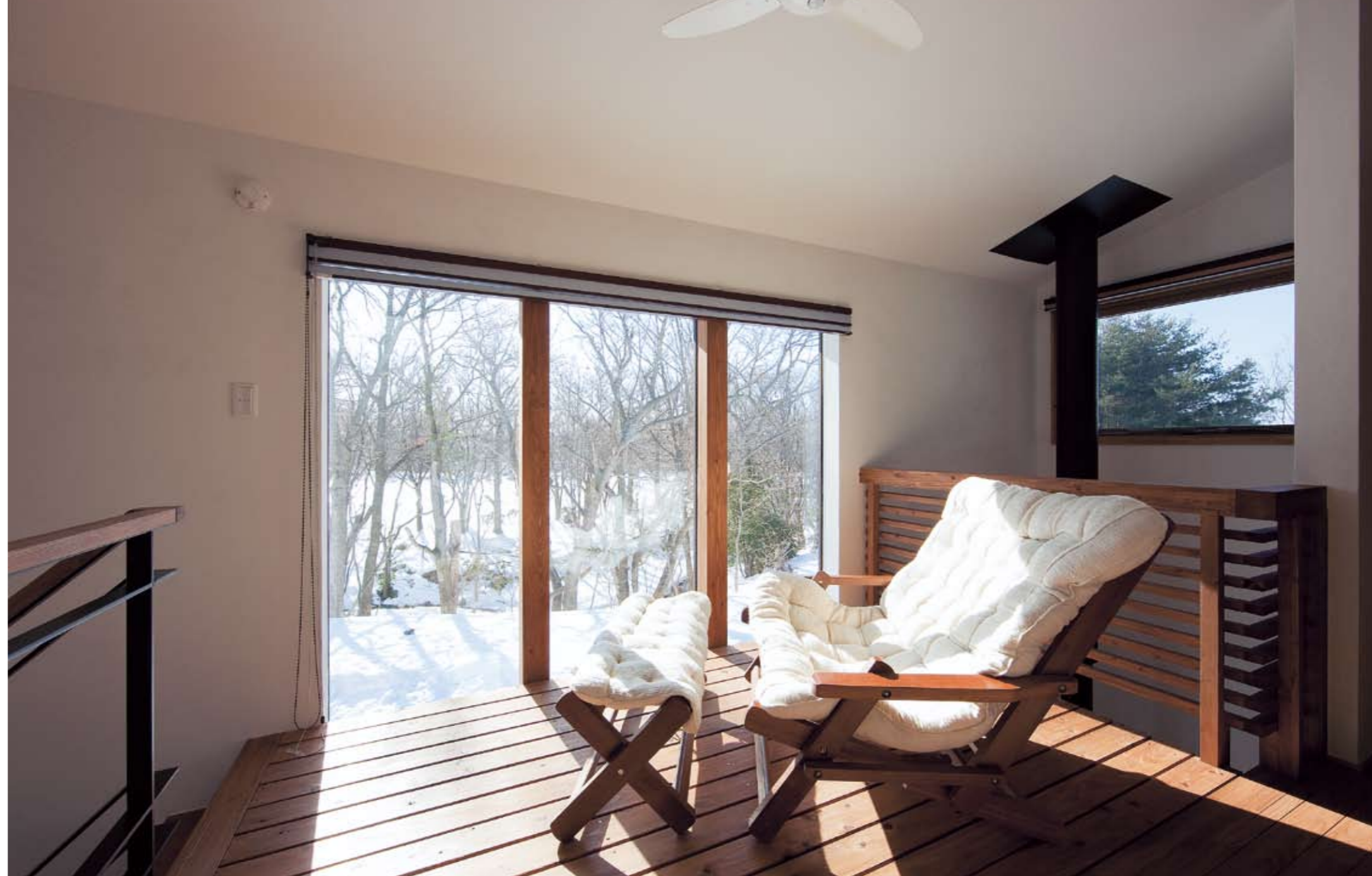
2階インナーデッキから、小川と雑木林の風景を一望。四季の自然の移ろいが室内に居ながらにして楽しめる

● 北方型住宅 ECOプロジェクト参加企業 ● 新木造住宅技術研究協議会 ● <家づくりWEBセンター> 登録企業 ● とじこみハガキ(1)をご利用ください。